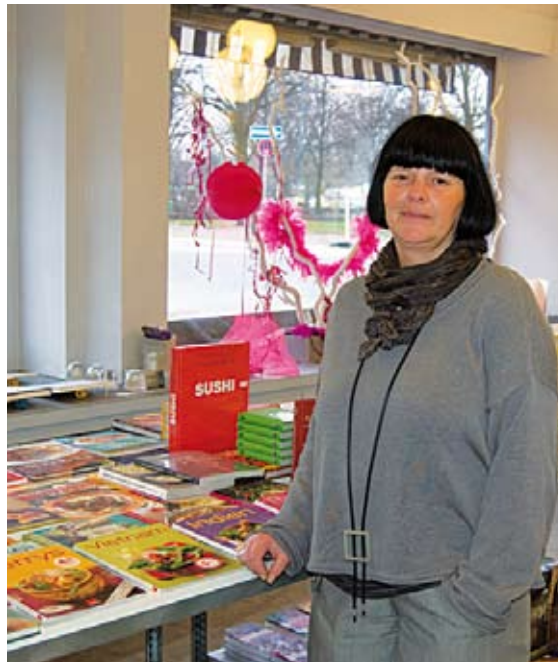
BuchArt: Neue Lesart für Lebensart in Kleve