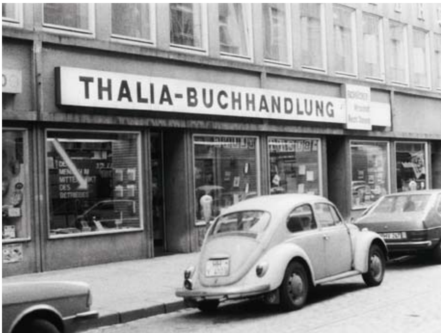
Buchhandel: Früher hatten alle Buchhandlungen ihr unverwechselbares, mittelständisches Gesicht