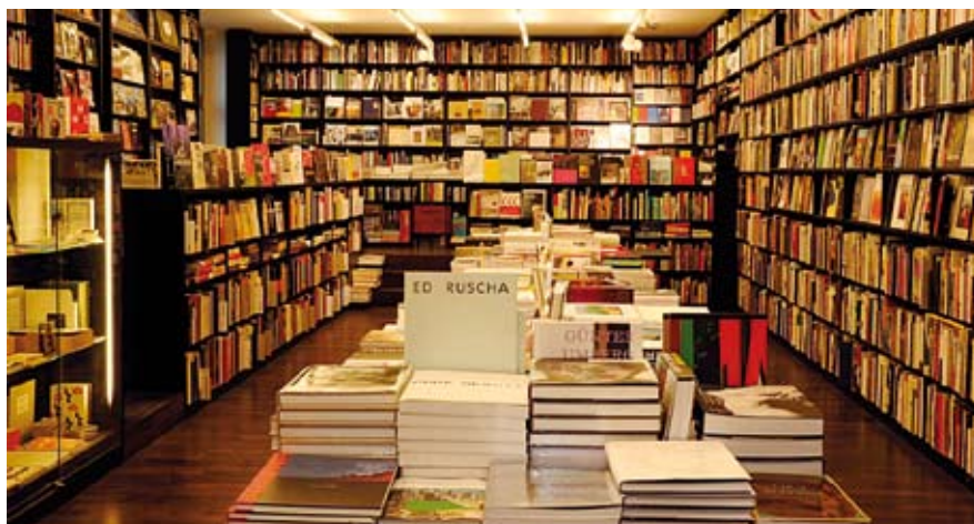
Kunst- und Architekturbuchhandel: Eleganter Auftritt in 25 Filialen der Buchhandlung Walther König S. 52