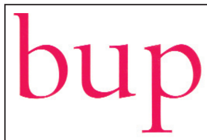
Zwei neue Verlage verstecken sich noch

Staffel vertretenen Autoren ist wieder dabei. Die Ausstattung knüpft nahtlos an die ersten 50 Bände an. Lediglich an der Preisfront haben sich die Münchner an einer Korrektur nicht vorbei bekommen. Jeder Band kostet künftig 5,90 €. „Schuld“ an diesem Preissprung soll aber nicht Gewinnstreben, sondern massiver Druck einer der Lizenzgeber gewesen sein.