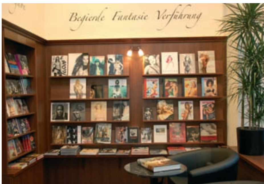
Sinn und Sinnlichkeit: Die erotische Buchhandlung in München ist im alten Stil eingerichtet